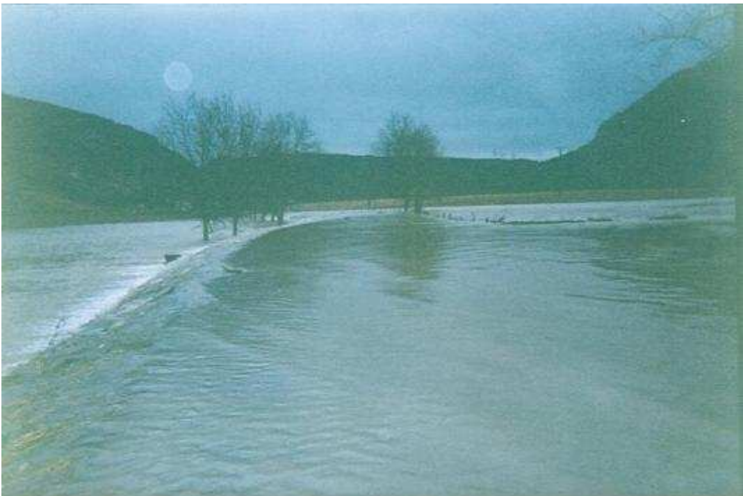
La D70 direction Nevy, depuis la limite communale Nevy / Voiteur