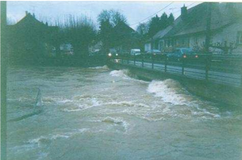
Samedi 20 février 1999 : pont sur la Seille à Voiteur, vue depuis l'amont vers la rive gauche