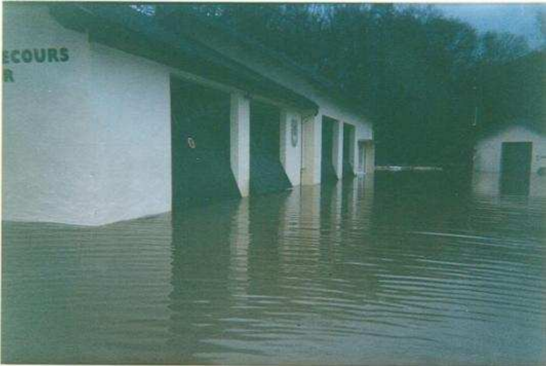
Le centre de secours