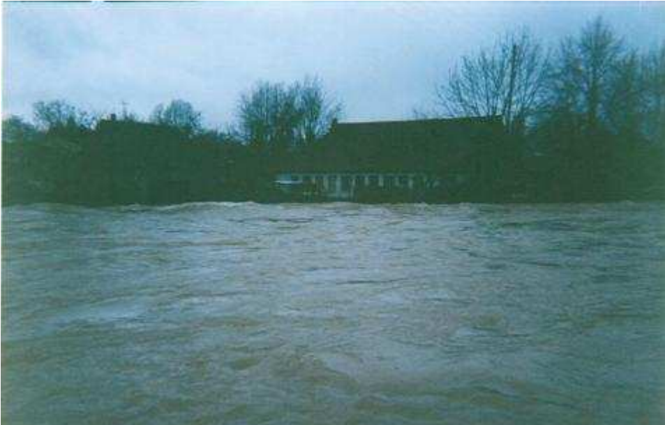
La seille au niveau du pont de Voiteur, vue vers l'aval