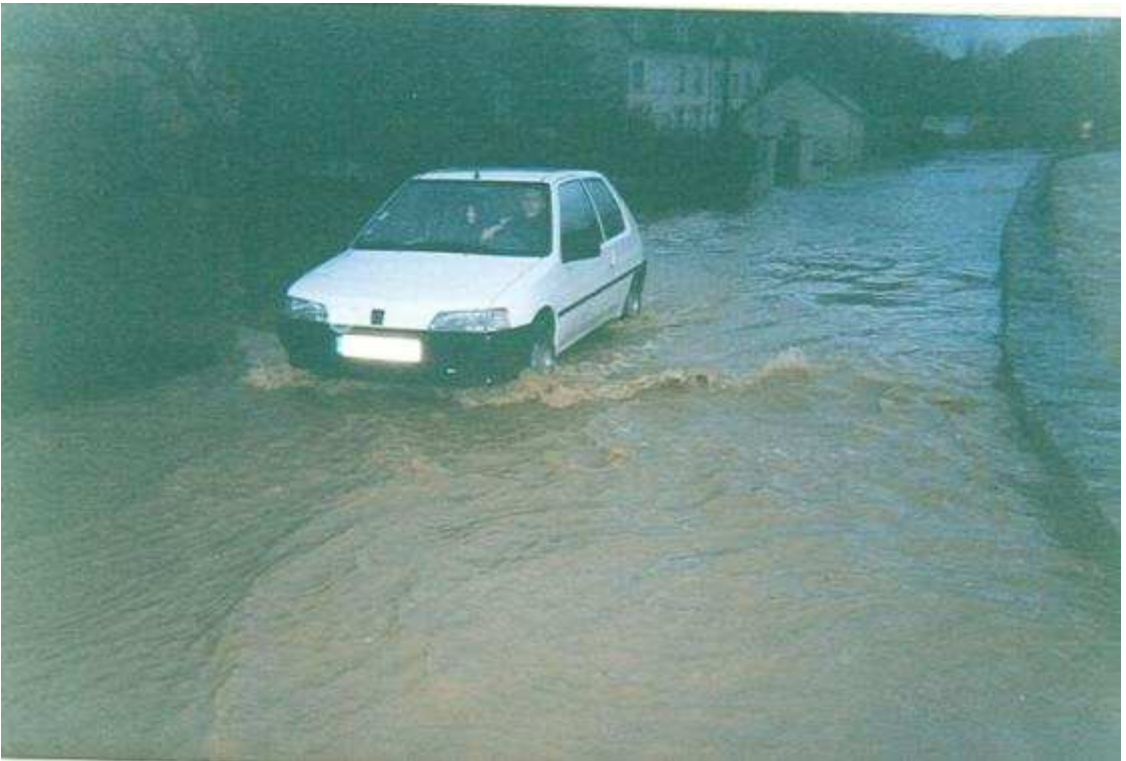
D57 entre Voiteur et Ménétru, vue en direction de Voiteur,