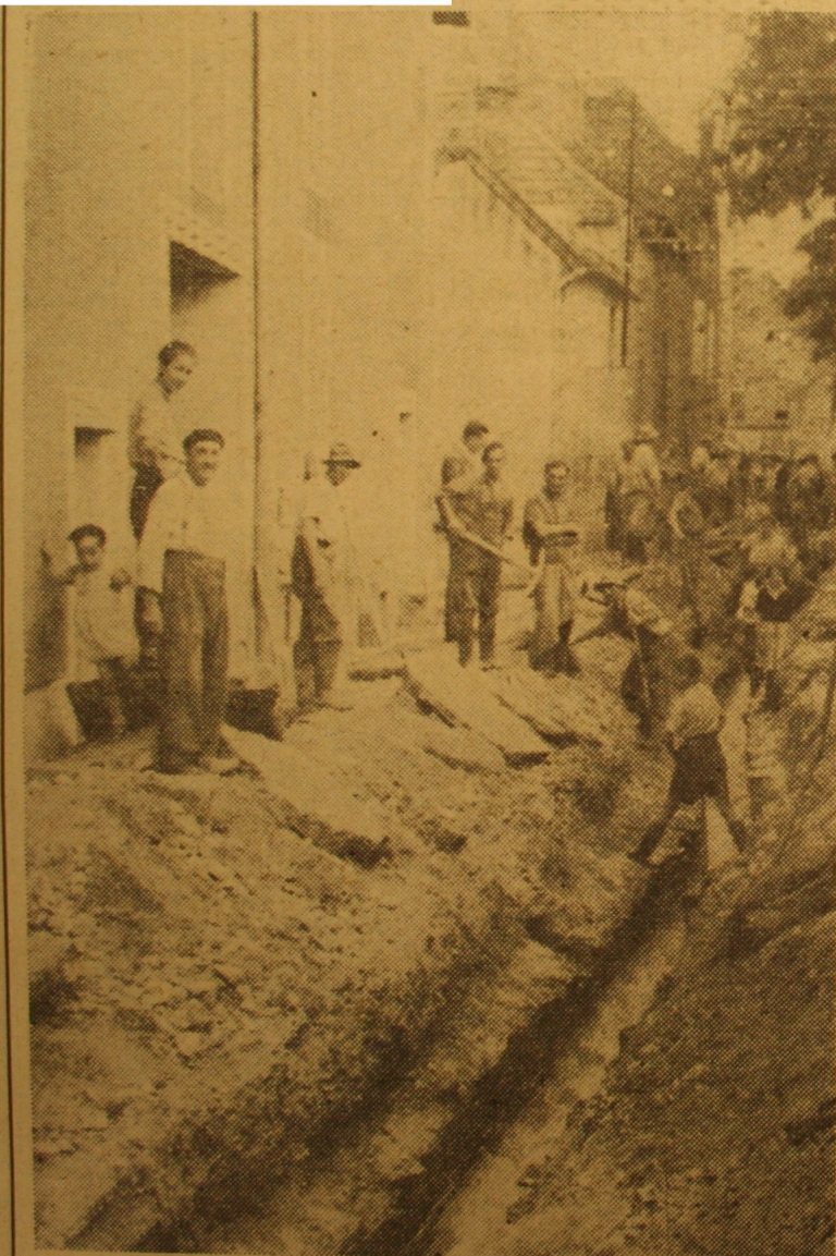
Pour permettre l'écoulement des eaux, les habitants de Volnay ont dû découvrir en hâte leur aqueduc