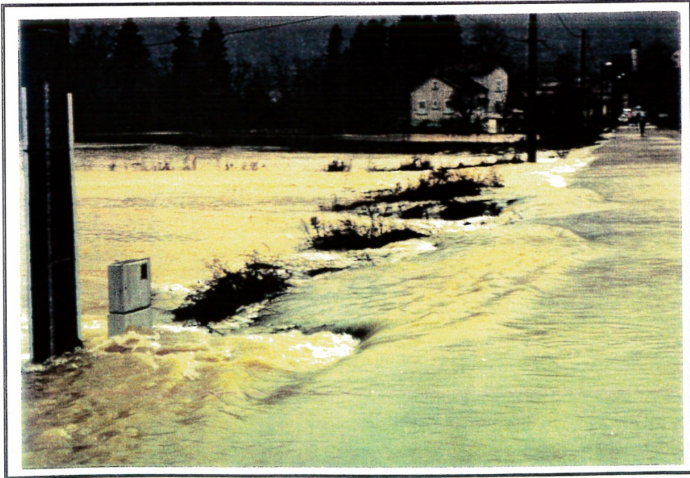
Photo 23 : Déversement sur la route d'accès au pont de JEURRE en décembre 1991.