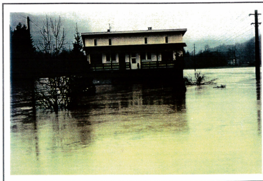
Photo 21 : Habitation inondée en décembre 1991 (laisse n°6).