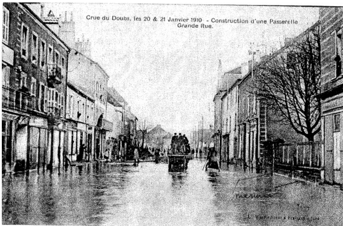
Construction d'une passerelle dans la Grande Rue