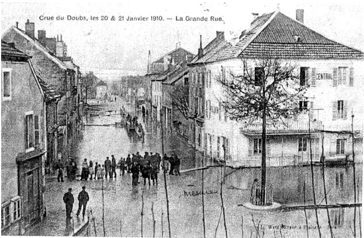
La Grande Rue à Fraisans