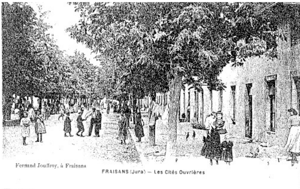
Entrée des forges et rez-de-chaussez des cités ouvrières