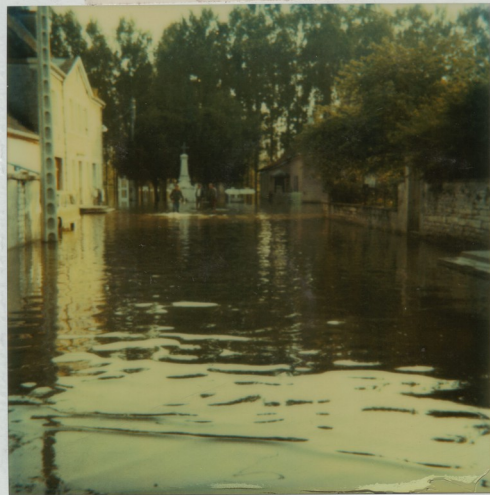
Centre Longuy Samedi 29 Mai 83. à 8h.