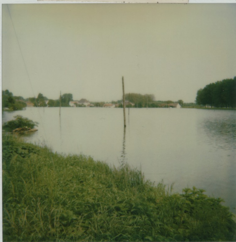
Champ de foire de Longuy. Samedi 28 Mai à 18h.