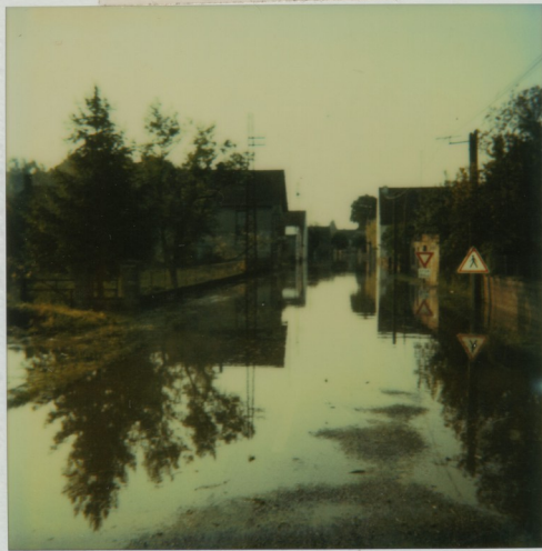
Entrée de Longuy, cote Jousserots. Samedi 28 Mai 83. à 8h00.