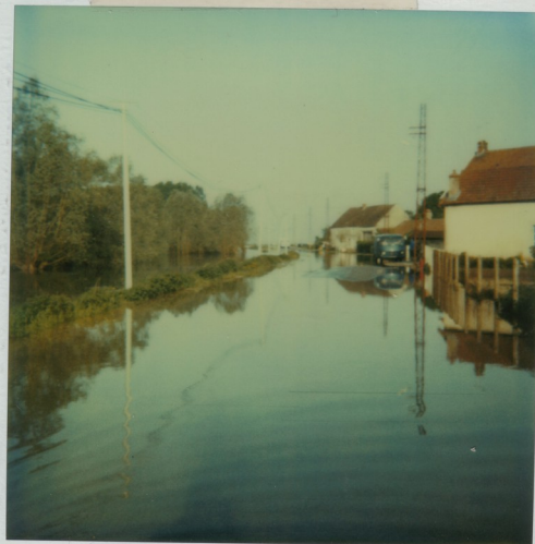
Sortie de Longuy, cote Petit Noir. Samedi 28 Mai à 8h.