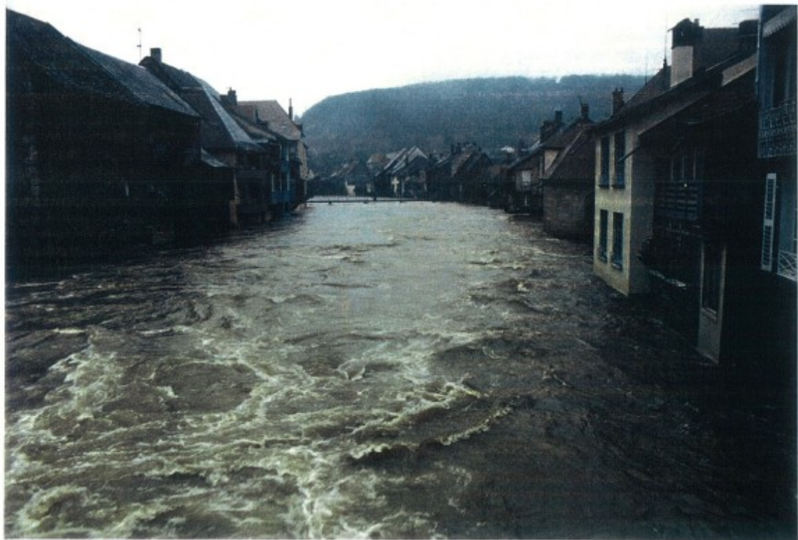
Crue de Décembre 1991