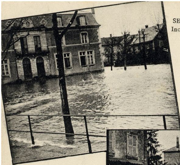
Place des Ecoles