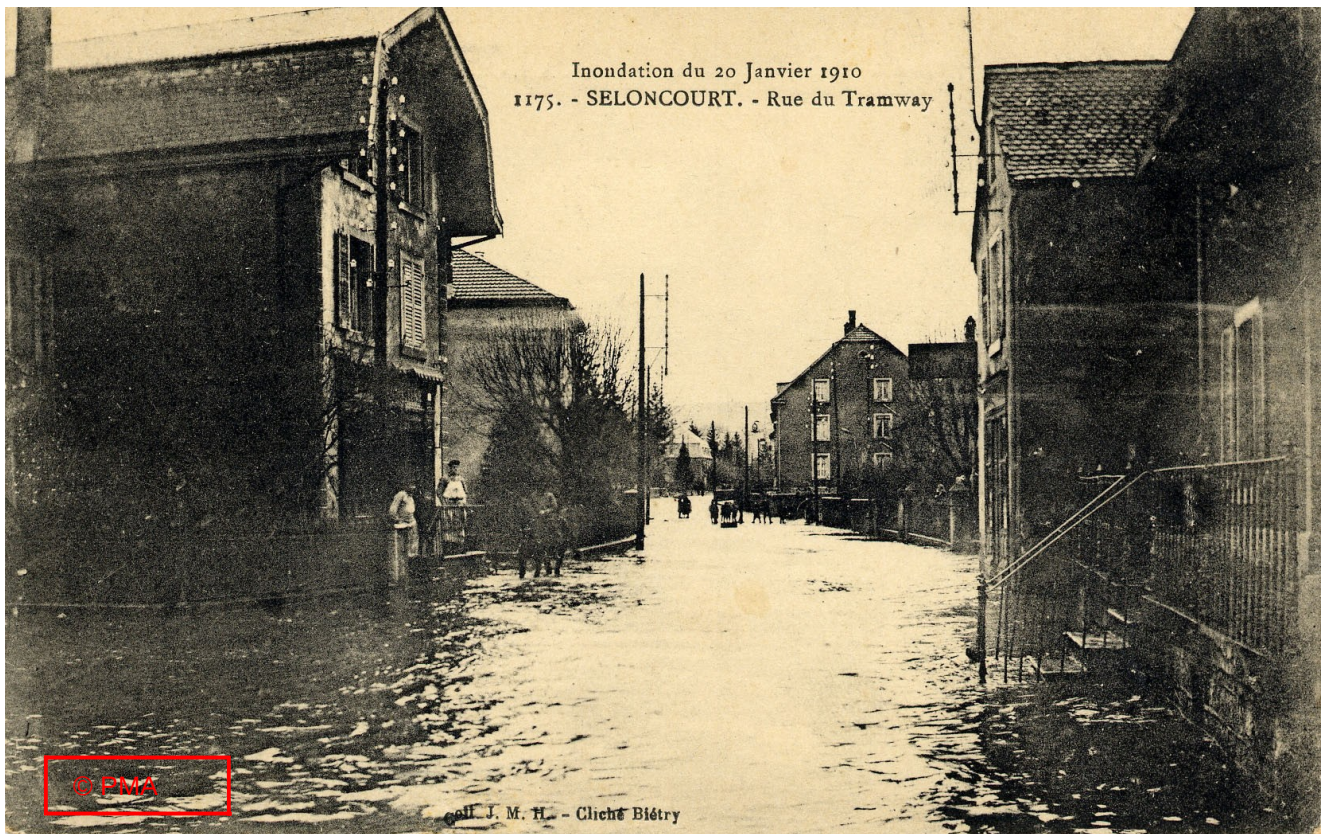
Inondation du 20 Janvier 1910 1175. - SELONCOURT. - Rue du Tramway