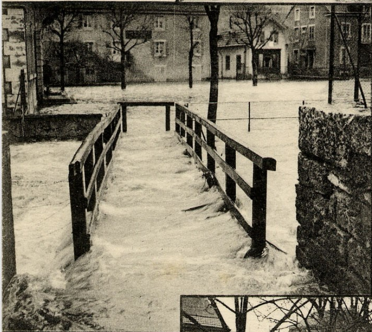
Passerelle des Ecoles