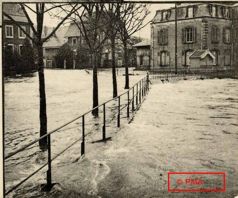
Le Gland (rive droite)