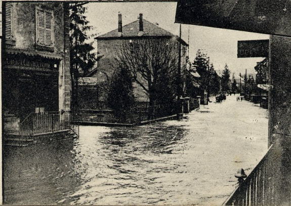
Rue du Tramway (amont)