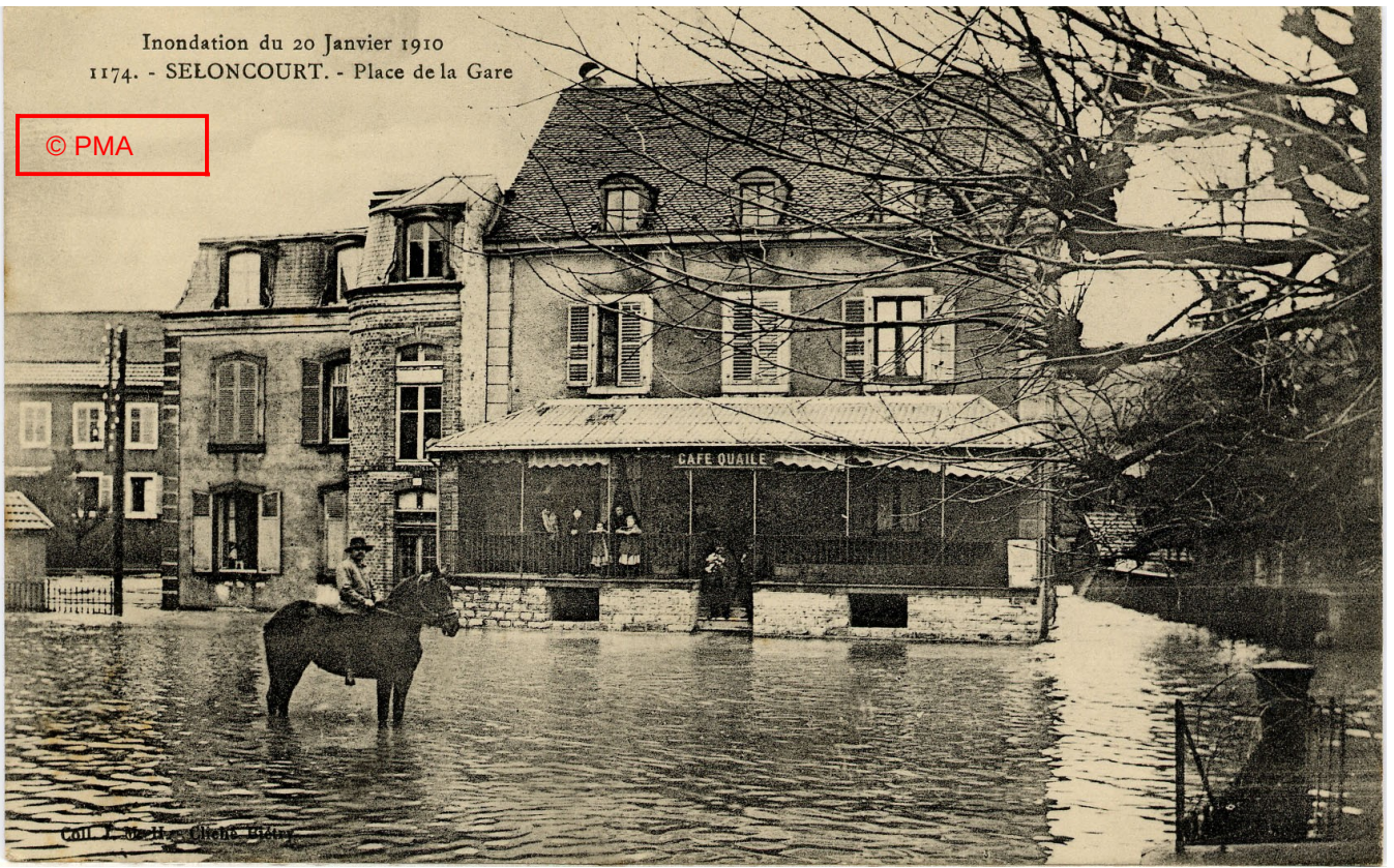
Coll. J. Berthe Rognon 1942