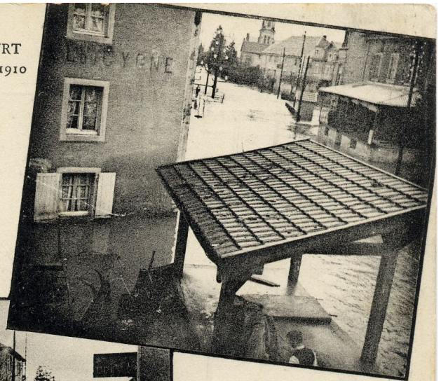
Rue du Tramway (aval)