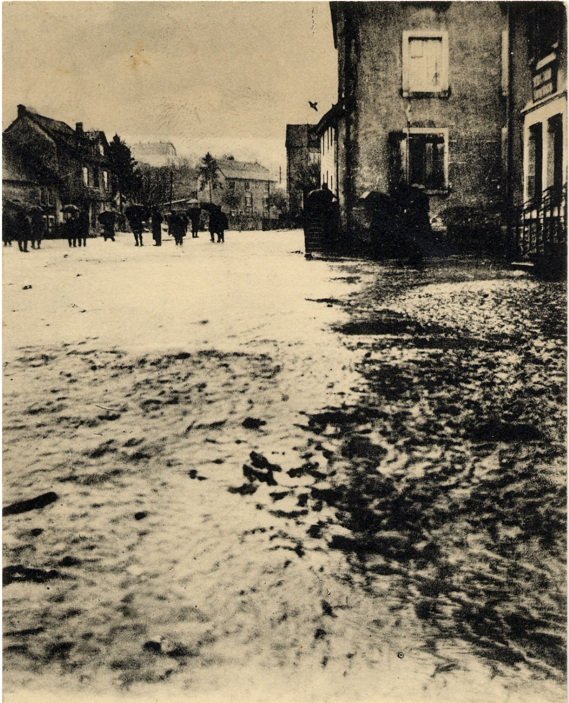
Inondation du 20 Janvier 1910 1172. - SELONCOURT. - Rue Viette