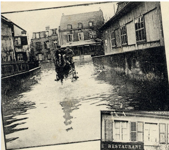
SELONCOURT Inondations 1910