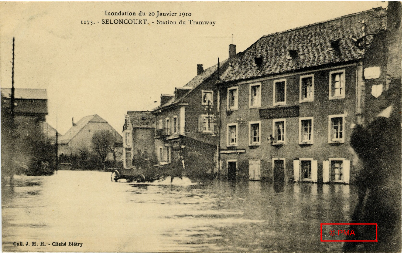
Inondation du 20 Janvier 1910 1173. - SELONCOURT. - Station du Tramway